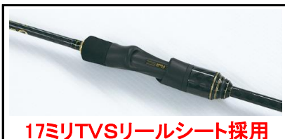
17ミリTVSリールシート採用